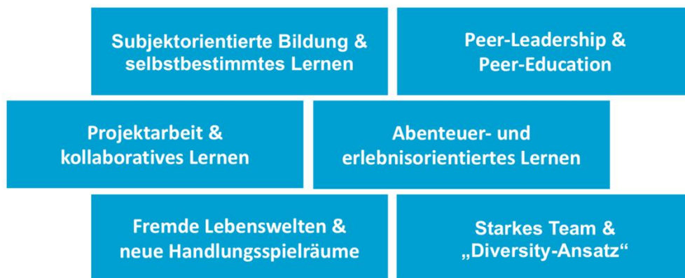
Abbildung 1: Die sechs Kernkomponenten von Peer-Leader-International

Trotz der unterschiedlichen Umstände, unter denen Bischoff und Makivnychuk ihre Peer-Leader-International-Standorte aufgebaut haben, weisen ihre Erfahrungsberichte viele Gemeinsamkeiten auf. Diese Schnittmengen lassen Rückschlüsse auf die zentralen Elemente von Peer-Leader-International zu und die Schritte, die beim Aufbau eines Peer-LeaderInnen-Teams essenziell sind. Die sechs Kernkomponenten von Peer-Leader-International können Abbildung 1 entnommen werden.